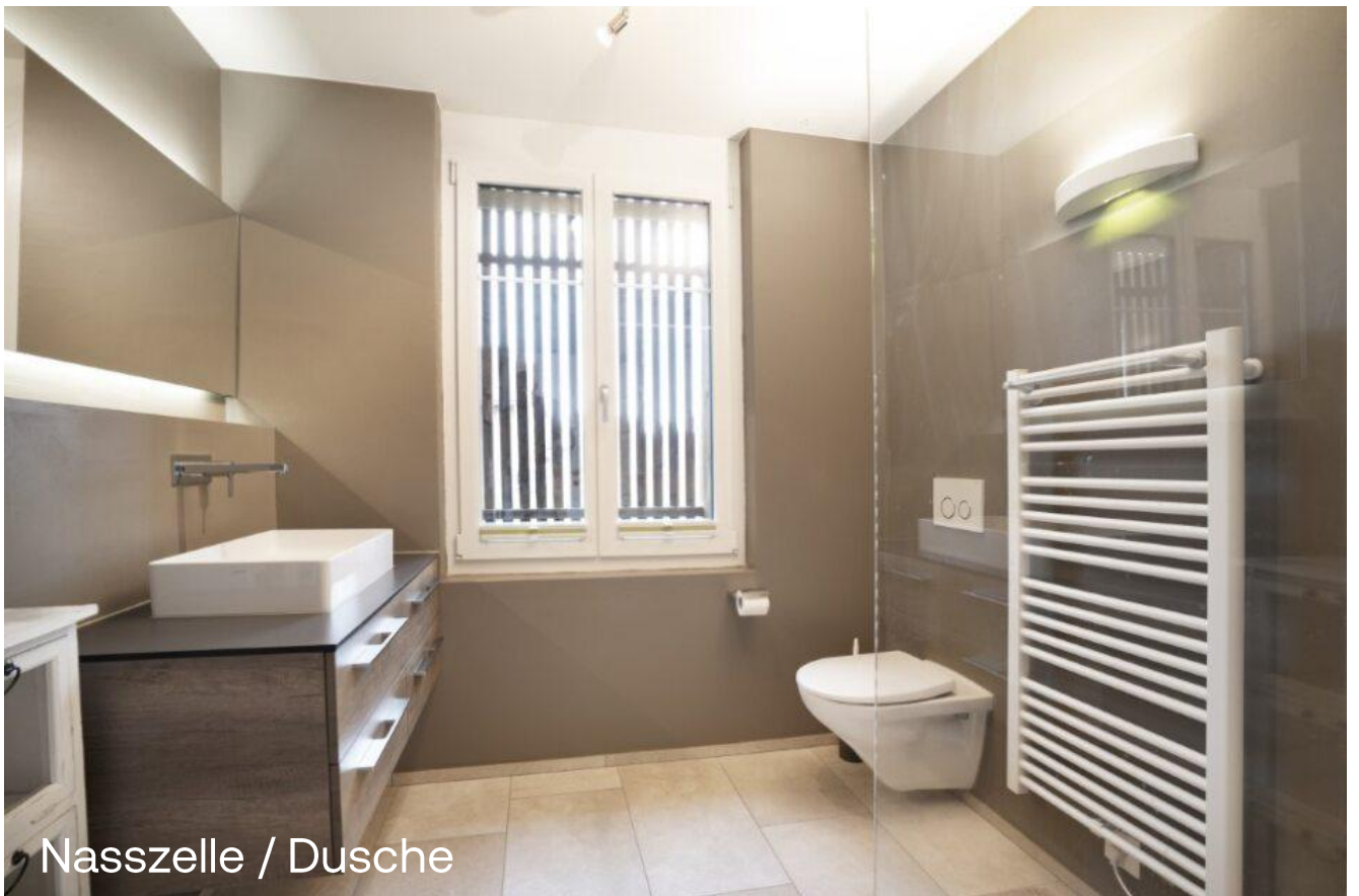
Nasszelle / Dusche