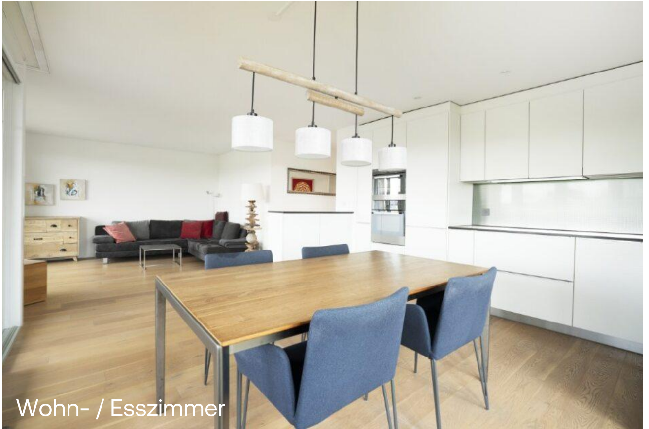
Wohn- / Esszimmer